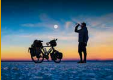
BESSER WELT ALS NIE (DE 2020)