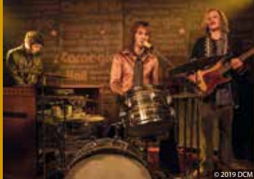
LINDENBERG! MACH DEIN DING! (DE 2019)