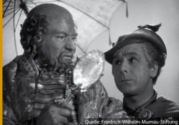
AMPHITRYON (DE 1935)

ersten LP bis zu seinem Durchbruch mit Songs wie „Mädchen aus Ost-Berlin“ und „Andrea Doria“.