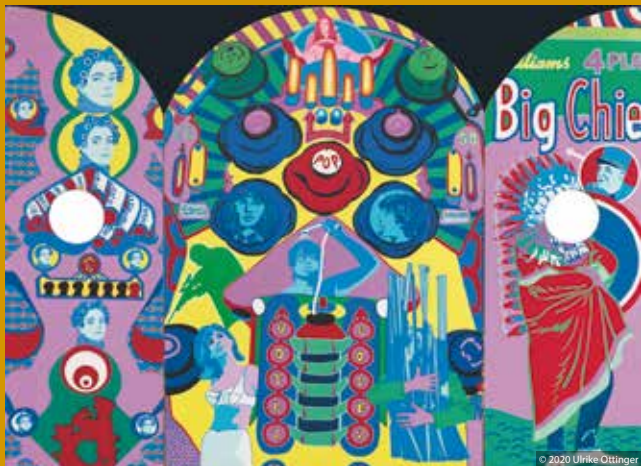
PARIS CALLIGRAMMES (DE/FR 2020)

Murnaustraße 6 | 65189 Wiesbaden | gegenüber Kulturzentrum Schlachthof